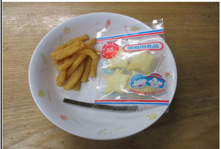
【おやつ:以上児】マカロニのきな粉和え・醤油こんにぶ・お菓子