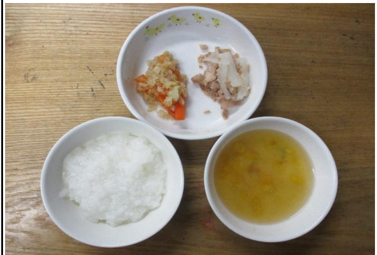
【離乳食】鶏肉のくず焼き・おなか和え・玉葱のすまし汁