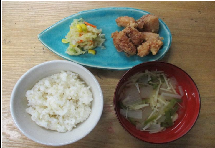
【普通食:以上児】鶏肉の唐揚げ・おなかマヨ和え・冬瓜のすまし汁

今日は冬瓜についてです。冬瓜は冬の瓜と書きますが、旬は夏です。そのまま冷暗所で保存しておけば、冬までもつことから、漢字では「冬瓜」（とうが）と記すようになったと言われています。形は丸形、円筒形、楕円形などさまざまです。原産地は、インドといわれており、日本には平安時代の書物『本草和名』で記載があるほど古くから親しまれてきた野菜です。